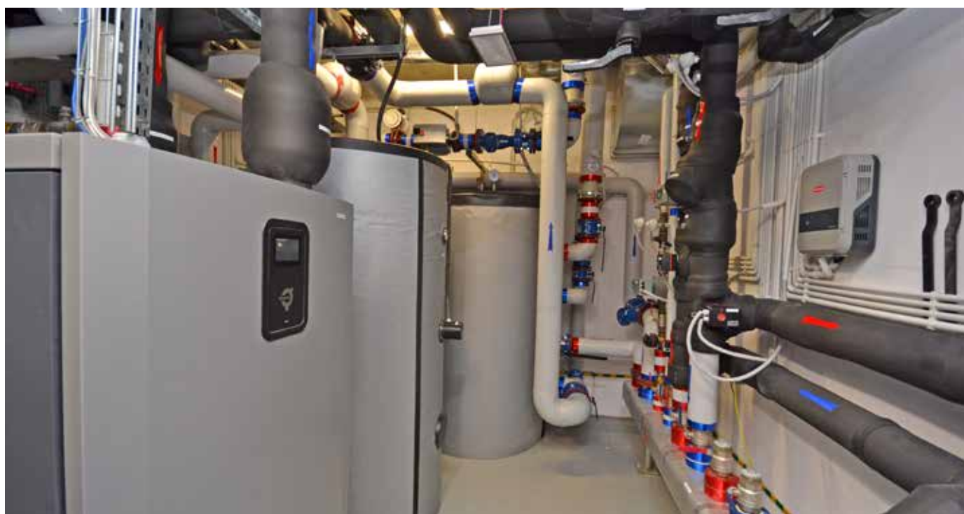
Pompa ciepła Mega (z lewej) w maszynowni budynku