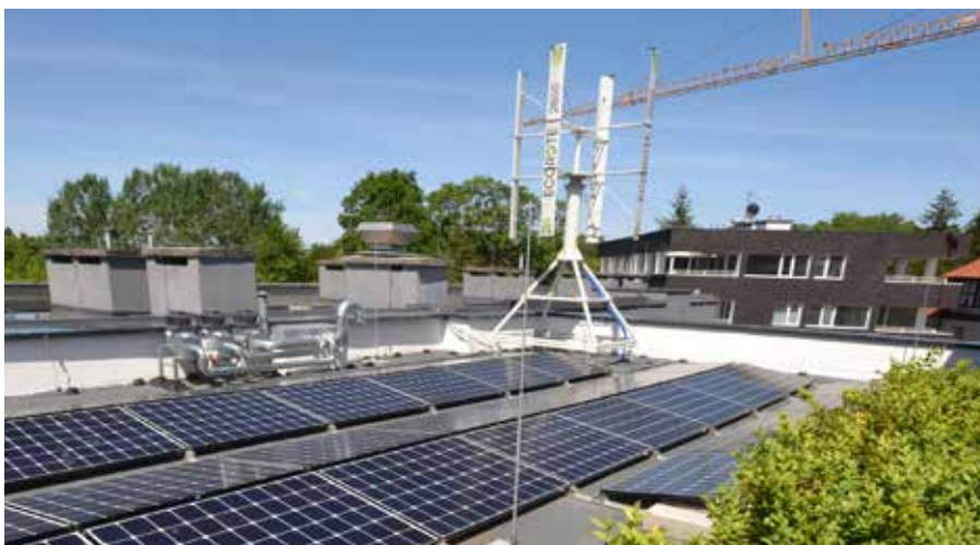
Panele fotowoltaiczne i turbina wiatrowa na dachu budynku

Rozwiązanie energetyczne, jakim jest pompa ciepła, umożliwia właścicielowi biurowca oferowanie usług na najwyższym poziomie, przy niskich kosztach eksploatacji z uwzględnieniem ochrony środowiska.