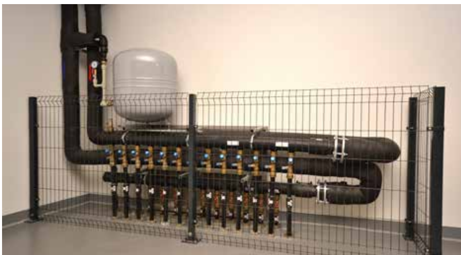
Rozdzielacze dolnego źródła pompy ciepła