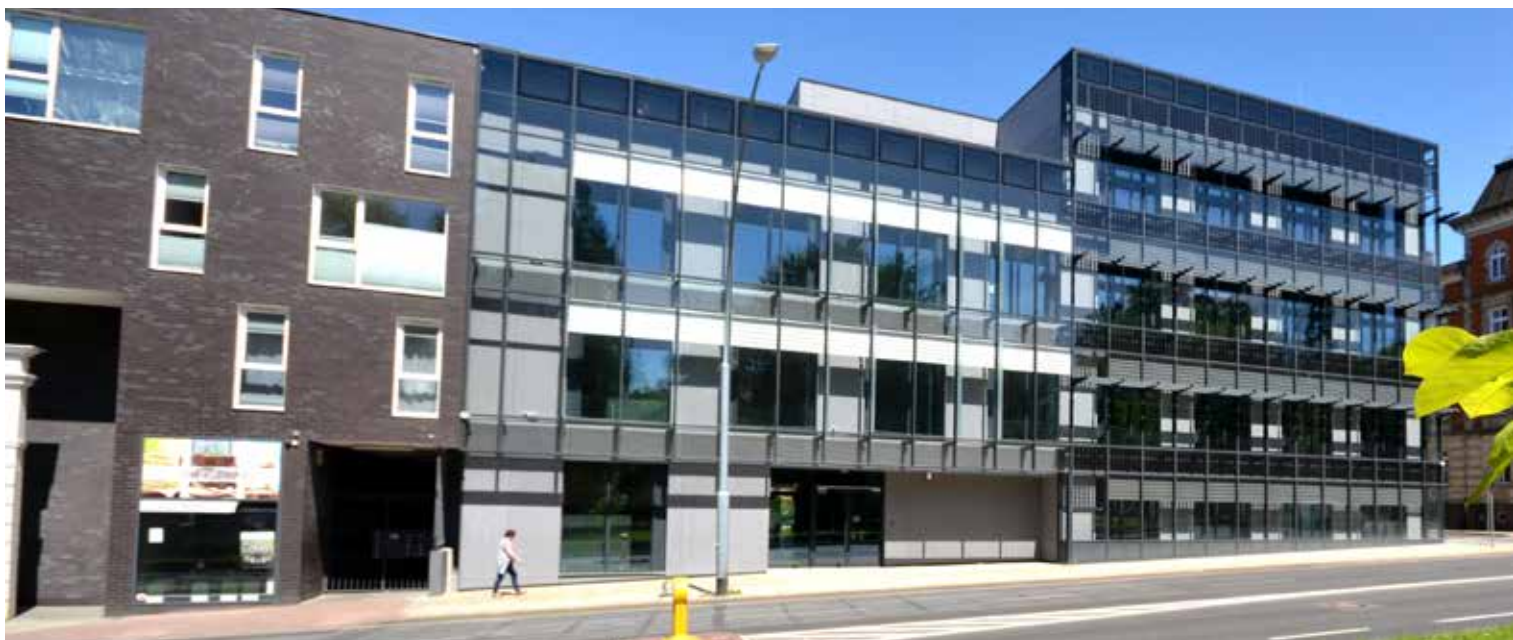
Biurowiec, siedziba koszalińskiego biura Wojewódzkiego Funduszu Ochrony Środowiska i Gospodarki Wodnej w Szczecinie