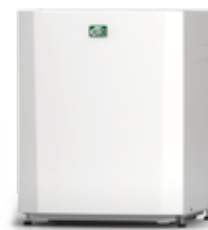
CTC EcoPart 406-412, 612M-616M