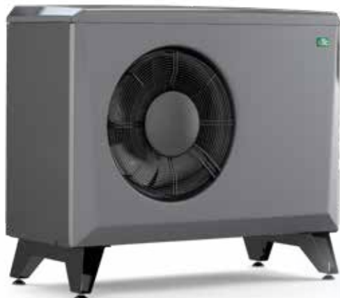
CTC EcoAir 406-408, 510M-622M

– szczegółowe informacje można znaleźć w dokumentacjach poszczególnych produktów.